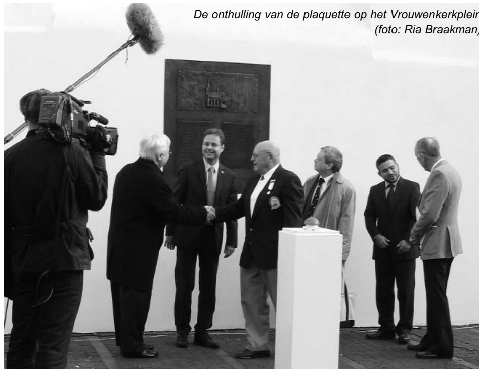
De onthulling van de plaquette op het Vrouwenkerkplein