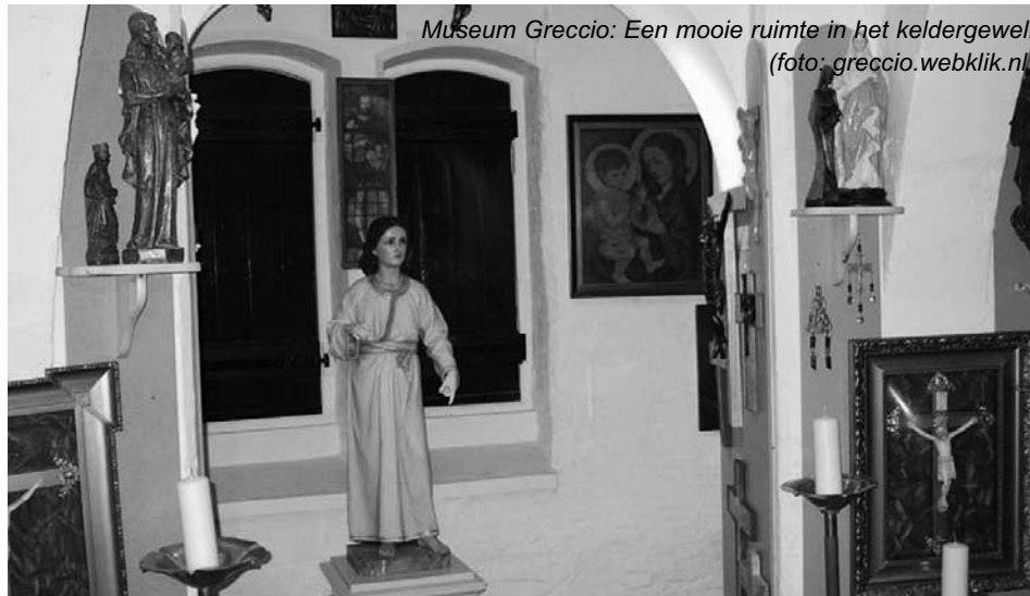
Museum Greccio: Een mooie ruimte in het keldergewelf

Op zaterdag 25 februari om 20.15 uur is er een uitvoering van het Nederlands Studenten Kamerkoor. Het programma is als volgt: Vd Heijden (A Collapsing Wave-function of Violence) en Kleppe (In Despair): wereldpremières; De Ruiters (Situaties); Hamburg (Woordjazz op Russische gegevens); Gershwin (Fascinating Rhythm); Garcia Abril (Cantar de Soledades); Jennefelt (Vinamintra Elitavi); Gustafson (Ihr Musici, frisch auf!) en Nystedt (Die Güte des Herrn) als Nederlandse premières; Nielsen (Sænk kun dit hoved, du blomst); Orban (Daemon irripit Callidos); Jobim (Girl from Ipanema);