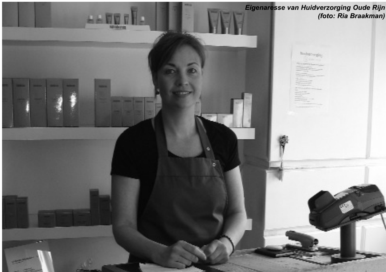
Eigenaresse van Huidverzorging Oude Rijn