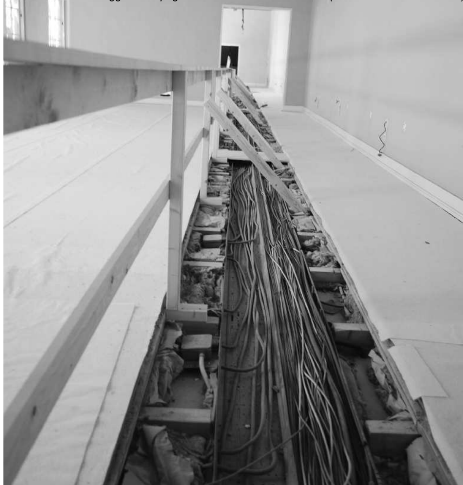
Elektriciteitsdraden liggen als spaghettislierten door het museum